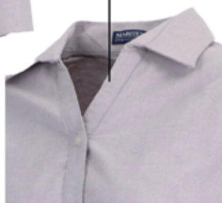
Pinzas de entalle en frente y espalda