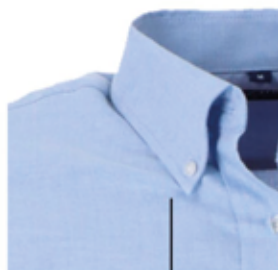
Cuello button down